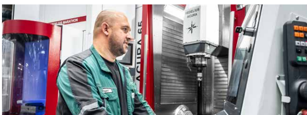
➤ ZERSpanungsmechaniker ♀