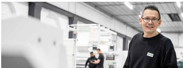
➤ INDUSTRIEMECHANIKER ♀

Speziell haben wir uns der qualitativ hochwertigen Ausbildung verschrieben. Wir stellen uns der Verantwortung und legen größten Wert auf die Vermittlung umfangreichen Fachwissens mit dem Ziel eines erfolgreichen Abschlusses der angestrebten Berufsausbildung. Lass Dich von uns als TOP Ausbildungsbetrieb ausbilden und werde eins mit der Maschine!