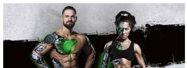
➤ WERDE EINS MIT DER MASCHINE