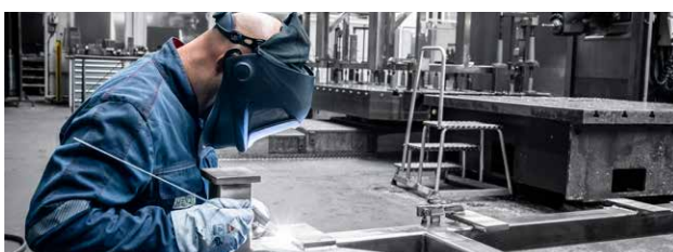
➤ KONSTRUKTIONSMECHANIKER ♀