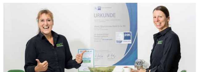
➤ INDUSTRIEKAUFLEUTE ♀