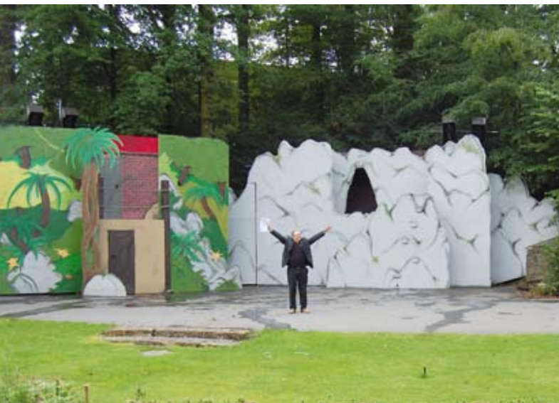
Bunte Kulissen unter freiem Himmel: Die Aufführungen der Waldbühne sind im Sommer bei Jung und Alt beliebt.

Oesede ist heute das Zentrum von Georgsmarienhütte, welches sich 1970 aus sechs eigenständigen Gemeinden freiwillig zusammengeschlossen hat. Neben Alt-Georgsmarienhütte/Malbergen, Harderberg, Holsten-Mündrup, Holzhausen und Kloster Oesede ist dieser Stadtteil mit etwa 14 Quadratkilometern der Größte. Die Straße führt uns vorbei am Rathaus auf St. Peter und Paul zu – die römisch-katholische Kirche aus dem Jahre 1903 liegt genau am Ende der Einkaufsmeile und ist nicht zu übersehen.