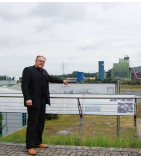
Informationstafeln auf der Aussichtsplattform zeigen wie das Gelände des berühmten Stahlwerkes früher einmal aussah.