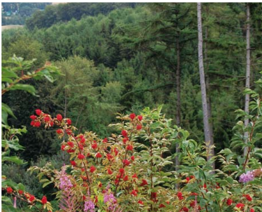
Georgsmarienhütte macht ihrem Namen alle Ehre: „Die Stadt im Grünen“ bietet viele herrliche Aussichten.