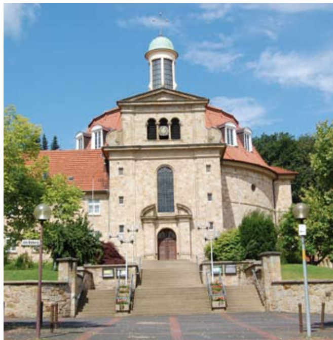
1915 von Holzhauser Männern gegründet, leben heute noch neun Franziskaner Brüder im Kloster Ohrbeck.