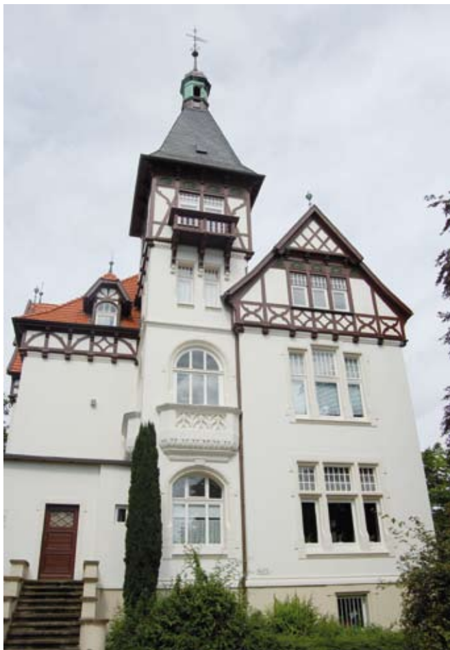
Neben einem Museum findet auch die Kunstschule Paletti Platz unter dem Dach der Villa Stahmer aus dem 19. Jahrhundert.